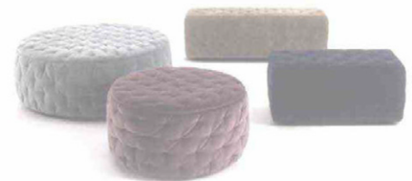
FRIGERIO Miller. Pouf in velluto rivestiti in tessuto ricamato