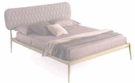
CANTORI Urbino. Letto in metallo con testata trapuntata