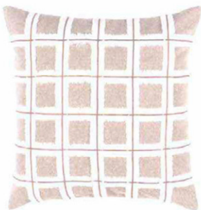
FAZZINI Snow. Cuscino in cotone con applicazioni