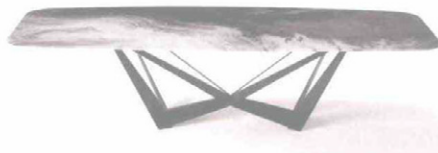
CATTELAN Skorpio crystalart. Tavolo con piano stampato