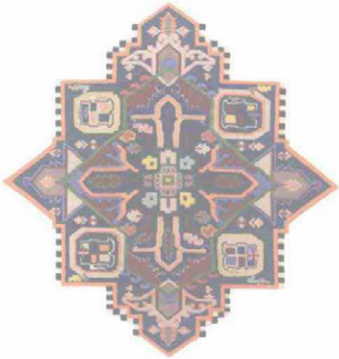
CC-TAPIS Tabriz destroyer. Tappeto in lana dell'Himalaya