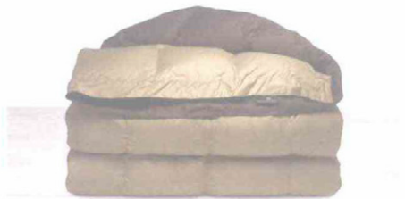
DAUNENSTEP Duna. Trapunta bicolore in cotone imbottita