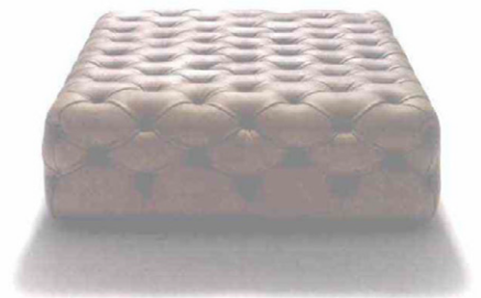
DE PADOVA Capitonné. Pouf con lavorazione a mano