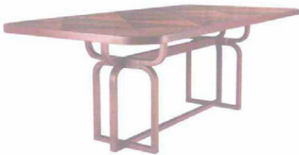
GTV Caryllon dining table. Tavolo con piano a intarsio