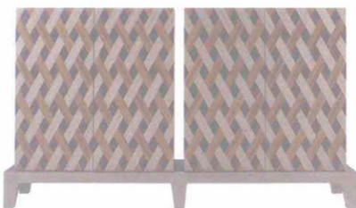
PROMEMORIA Amarcord. Mobile in legno con decori