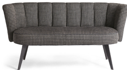
BORZALINO Diva. Divano rétro rivestito in tessuto