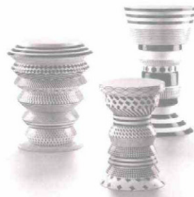
BOSA Bossanova. Tavolini in ceramica decorata a mano