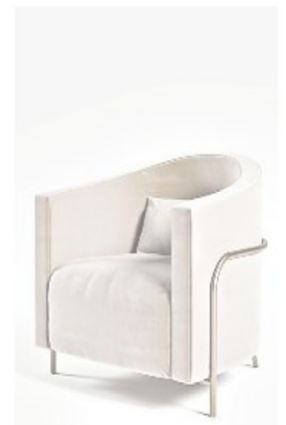
L'originale poltrona con struttura in marmo di Carrara di FranchiUmbertoMarmi, che debutta al Salone e, qui sopra, la poltroncina Giulia di Formitalia