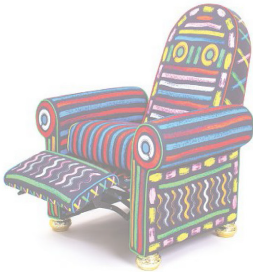
La poltrona Lazy Painter della collezione «Blow» di Job & Seletti: il carattere pop è nel Dna del marchio; in alto a destra, la soluzione living di Doimo con il divano lineare Leonard e, sotto, il design che riprende alcune suggestioni nordiche delle sedute Ayrton di Borzalino