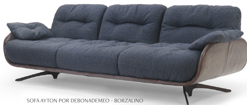
SOFA AYTON POR DEBONADEMEO - BORZALINO