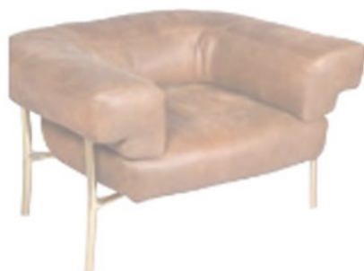
POLTRONA KATANA BY PAOLO RIZZATTO GHIDINI1961.