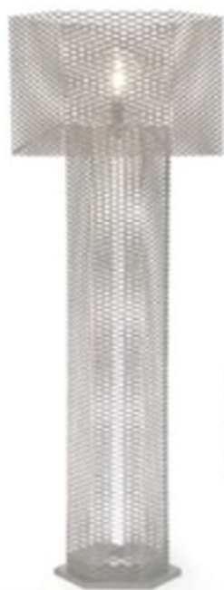
LUMINÁRIAS DE CHÃO ALPHA-ONE TONINO LAMBORGHINI CASA.