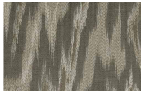
VALENZA Z598 - 03