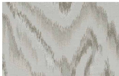
VALENZA Z598 - 01

Composition : 100% coton Largeur : 136 cm Répétition du motif : vertical: 50 cm horizontal: 68,5 cm Martindale : 60000 Motif : jacquard