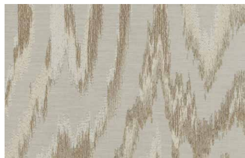
VALENZA Z598 - 02