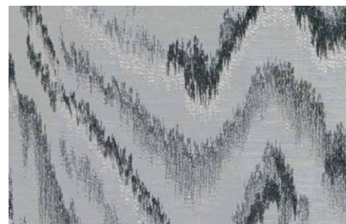
VALENZA Z598 - 04