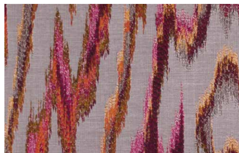
VALENZA Z598 - 06