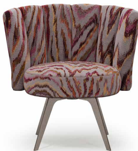
DIVA - VALENZA Z598 - 06

Tutte le immagini sono inserite a scopo illustrativo, i colori sono puramente indicativi e possono differire dai toni reali. All images are shown for illustrative purposes, the colors are purely indicative and may differ from the real tones. Toutes les images sont présentées à titre d'illustration, les couleurs vues sur l'écran sont purement indicatives et peuvent différer des tons réels.