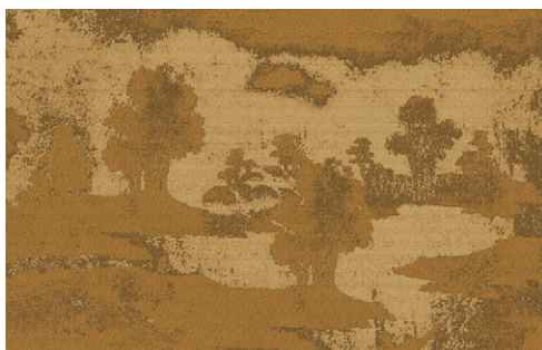
SUMI 30093 - 4