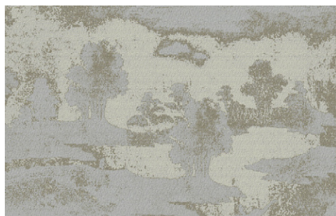
SUMI 30093 - 1

Composition : 100% polyester TREVIRA CS Largeur : 135 cm Répétition du motif : vertical: 70 cm horizontal: 66 cm Martindale : 22000 Motif : jacquard