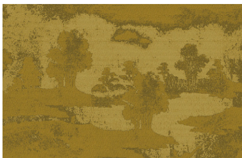
SUMI 30093 - 2