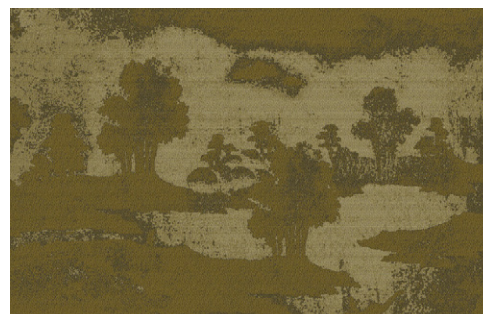
SUMI 30093 - 3