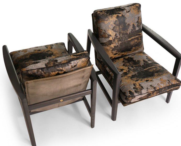
SEAN - SUMI 30093 - 5

Tutte le immagini sono inserite a scopo illustrativo, i colori sono puramente indicativi e possono differire dai toni reali. All images are shown for illustrative purposes, the colors are purely indicative and may differ from the real tones. Toutes les images sont présentées à titre d'illustration, les couleurs vues sur l'écran sont purement indicatives et peuvent différer des tons réels.