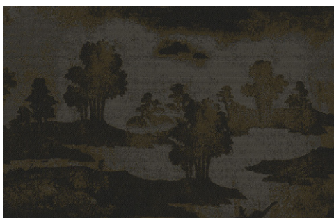
SUMI 30093 - 5