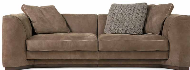
FRANKLIN - RUSTICO 17

Tutte le immagini sono inserite a scopo illustrativo, i colori sono puramente indicativi e possono differire dai toni reali. All images are shown for illustrative purposes, the colors are purely indicative and may differ from the real tones. Toutes les images sont présentées à titre d'illustration, les couleurs vues sur l'écran sont purement indicatives et peuvent différer des tons réels.