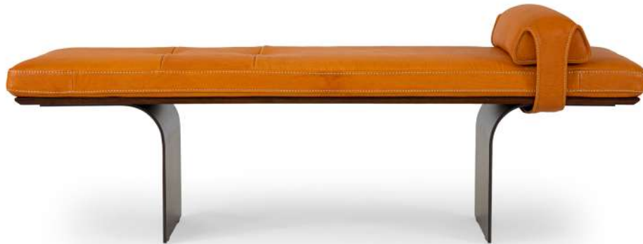
bench 150x45 h 46 / Seat+arm leather art. WATERFALL col. 45. Under seat lacquered Light Brown Oak. Metal feet finish col. Vulcan Grey.