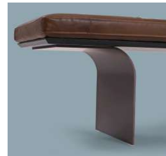
piedi in metallo metal feet pieds en métal