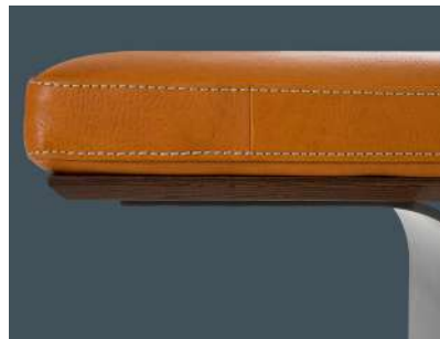
sottopiano in legno wooden support top panneau de soutien en bois