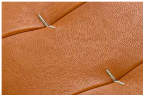
cucitura a Zig-Zag compatto compact Zig-Zag stitching coudre Zig-Zag compacte