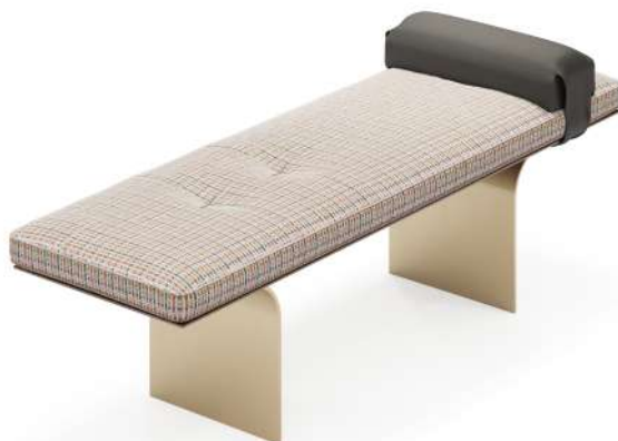
bench 150x45 h 46 / Seat fabric art. KUBOA 9072 col. 04. Arm leather art. SEQUOIA col. 4027. Under seat lacquered Light brown oak wood. Metal feet finish col. YY2761 Beige.

Consulta i legni Discover the woods Consultez les bois