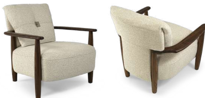
armchair 80x84 h 78

Consulta i legni Discover the woods Consultez les bois