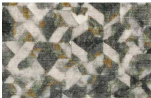
KALEIDO 9041 - 01

Composition : 55% viscose, 45% coton Poil : 100% viscose Largeur : 136 cm Répétition du motif : vertical: 55 cm horizontal: 34 cm Martindale : 100000 Motif : velours imprimé