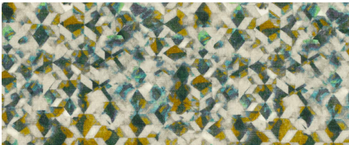
KALEIDO 9041 - 02

Tutte le immagini sono inserite a scopo illustrativo, i colori sono puramente indicativi e possono differire dai toni reali. All images are shown for illustrative purposes, the colors are purely indicative and may differ from the real tones. Toutes les images sont présentées à titre d'illustration, les couleurs vues sur l'écran sont purement indicatives et peuvent différer des tons réels.