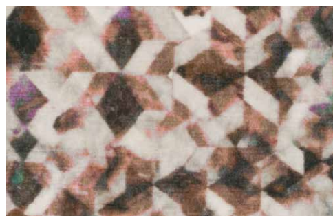
KALEIDO 9041 - 03