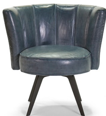
DIVA - GHOST 36