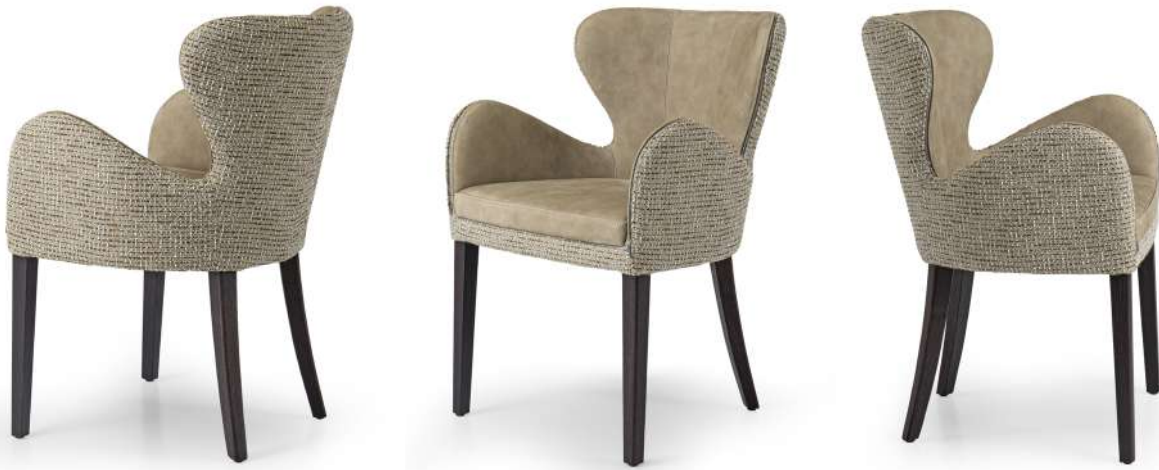
chair 58x56 h 80 / Outside frame fabric art. AGORA 71384 col. 004. Inside frame leather art. RUSTICO col. 11. Solid brown oak wooden feet.