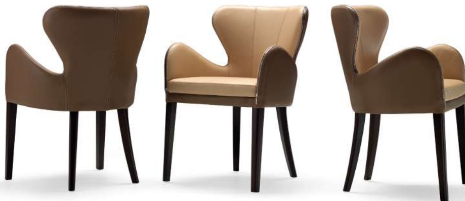
chair 58x56 h 80 / Outside frame Leather art. SETA col. 32488. Inside frame and seat cushion Leather art. SETA col. 22211. Thread col. 8362. Lacquered Wenge wooden feet.

Consulta i legni Discover the woods Consultez les bois