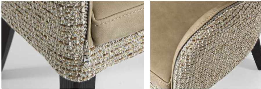
cerniera in metallo con pendente in strass metal zip with strass pendant fermeture éclair en métal avec strass pendentif