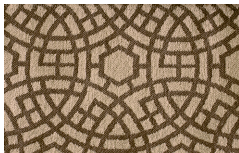
COMISO - 2