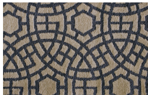
COMISO - 6