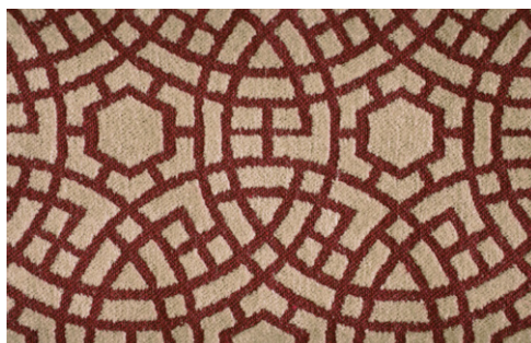
COMISO - 5