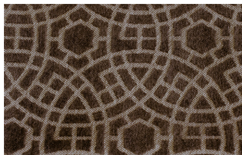
COMISO - 3