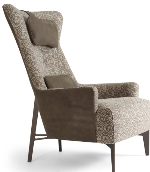
MIA - COMISO - 2

Tutte le immagini sono inserite a scopo illustrativo, i colori sono puramente indicativi e possono differire dai toni reali. All images are shown for illustrative purposes, the colors are purely indicative and may differ from the real tones. Toutes les images sont présentées à titre d'illustration, les couleurs vues sur l'écran sont purement indicatives et peuvent différer des tons réels.