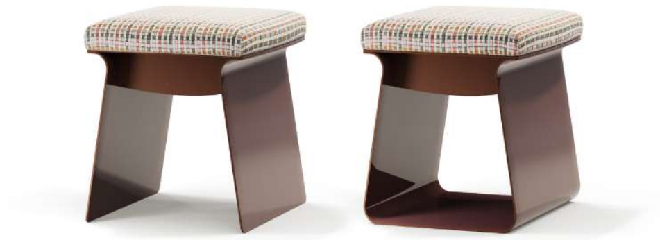
GEA 40x40 h 45 - CLIO 40x40 h 45 Seat fabric art. KUBOA col. 04. Metal base finish col. SW268JR Bronze.