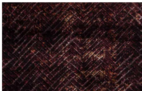
CHEVRON - 4