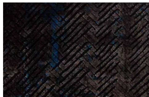
CHEVRON - 6