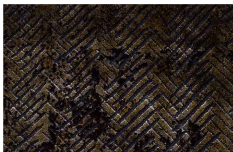
CHEVRON - 3