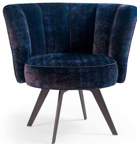
DIVA - CHEVRON - 6

Tutte le immagini sono inserite a scopo illustrativo, i colori sono puramente indicativi e possono differire dai toni reali. All images are shown for illustrative purposes, the colors are purely indicative and may differ from the real tones. Toutes les images sont présentées à titre d'illustration, les couleurs vues sur l'écran sont purement indicatives et peuvent différer des tons réels.