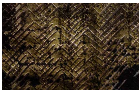
CHEVRON - 7