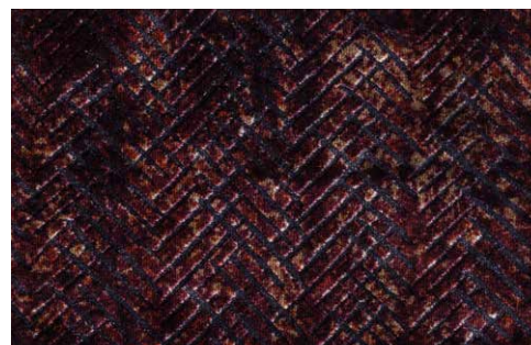
CHEVRON - 5