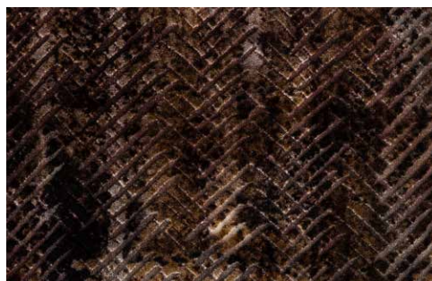
CHEVRON - 2