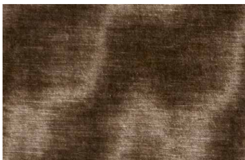
BONSULTON Z625 - 06