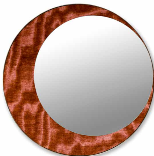
ECLIPSE - BONSULTON Z625 - 07

Tutte le immagini sono inserite a scopo illustrativo, i colori sono puramente indicativi e possono differire dai toni reali. All images are shown for illustrative purposes, the colors are purely indicative and may differ from the real tones. Toutes les images sont présentées à titre d'illustration, les couleurs vues sur l'écran sont purement indicatives et peuvent différer des tons réels.