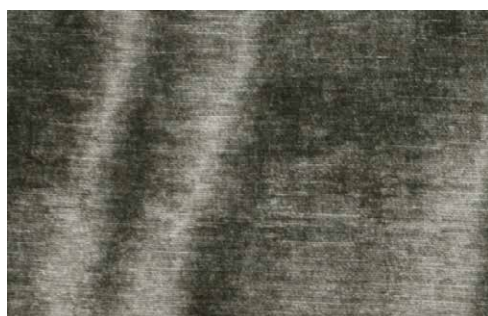
BONSULTON Z625 - 02