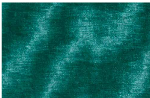
BONSULTON Z625 - 03