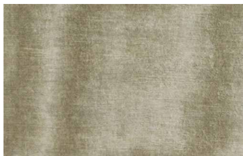
BONSULTON Z625 - 05

Composition : 42% coton, 58% viscose poil: 100% viscose Largeur : 137 cm Répétition du motif : vertical: 87 cm horizontal: 137 cm Martindale : 40000 Motif : velours imprimé