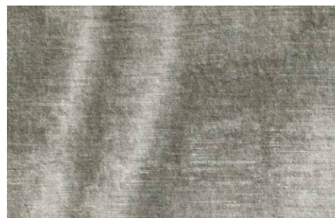
BONSULTON Z625 - 01