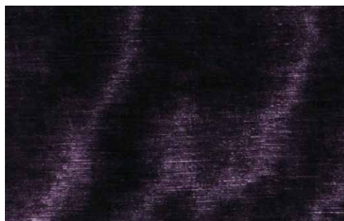
BONSULTON Z625 - 04