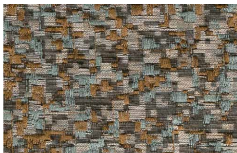
ARAZZO 9047 - 04