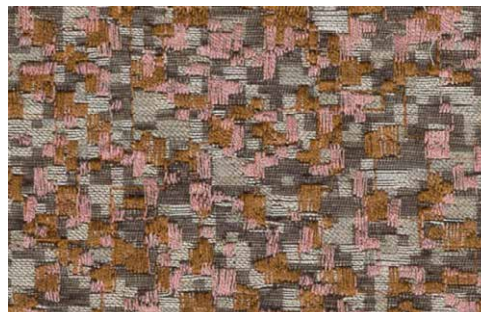
ARAZZO 9047 - 03