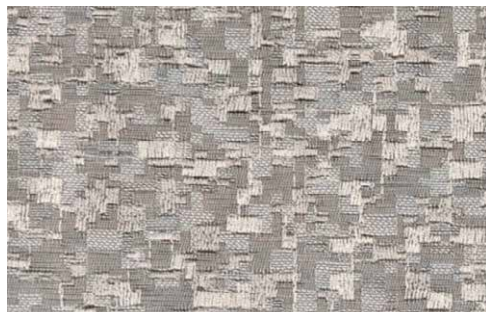
ARAZZO 9047 - 01

Utilisation UNIQUEMENT pour les coussins déco