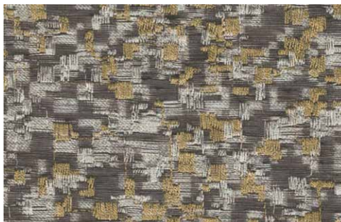
ARAZZO 9047 - 02